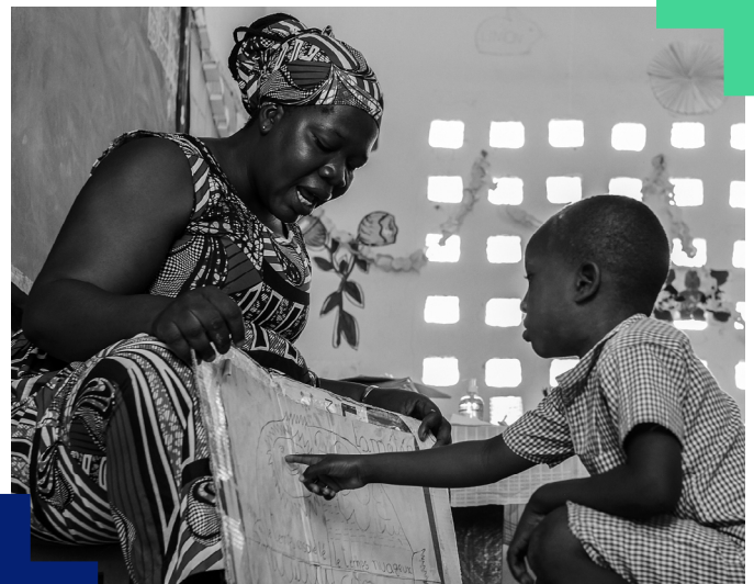
Une enseignante et son élève en classe à l'école maternelle communautaire de Nambirghékaha, en Côte d'Ivoire.

La Côte d'Ivoire poursuivra le service de sa dette à l'égard de la France conformément à l'échéancier convenu avec son créancier. Une fois le paiement effectué, la France transférera, par l'intermédiaire de l'Agence française de développement, le montant équivalent à la Côte d'Ivoire sous la forme d'un don. Les fonds seront déposés sur un compte spécial de la Banque centrale de Côte d'Ivoire. Grâce à cette opération de conversion, 77,1 millions de dollars seront investis dans des programmes d'éducation.