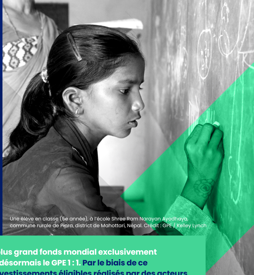
Une élève en classe (5e année), à l'école Shree Ram Narayan Ayodhya, commune rurale de Pipra, district de Mahottari, Népal.

Un fond de contrepartie de 1 : 1 pour les investissements dans l'éducation dans les pays à plus faible revenu