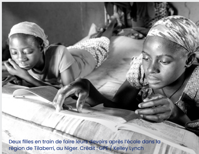
Deux filles en train de faire leurs devoirs après l'école dans la région de Tilabéri, au Niger.

Le GPE 1 : 1 double les contributions jusqu'à un total de 25 millions de dollars, ce qui représente 10 % de l'enveloppe financière prévue du guichet de l'Accélérateur de l'Éducation des Filles. Cette opportunité est limitée dans le temps : une fois que l'objectif global du guichet aura été atteint, la contrepartie ne sera plus accessible. Contrairement au fonds à effet multiplicateur, seules les contributions financières peuvent déclencher le GPE 1 : 1 pour l'Accélérateur d'Éducation des Filles.